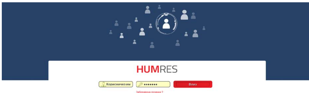
Слика 2-5: Страница за најавување

На главната страница корисникот ги внесува корисничкото име и лозинка и го притиска копчето Влез . Системот го прикажува главниот екран на апликацијата со расположливите опции во менито (согласно со привилегиите на корисникот). Откако ќе ги изврши активностите, корисникот може да го притисне копчето „Излез“ во менито на апликацијата.